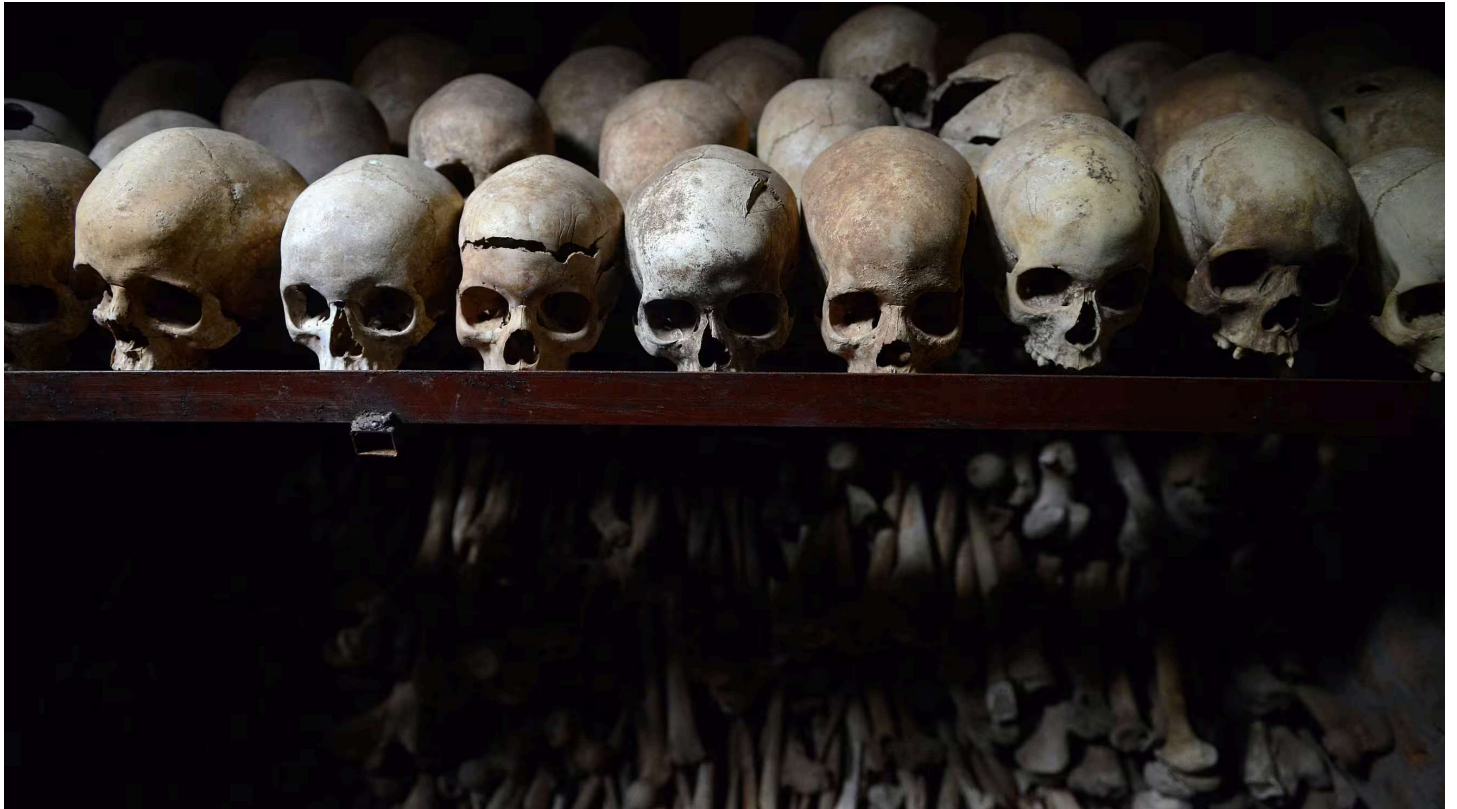
Des crânes humains exposés au mémorial du génocide à Nyamata au Rwanda.

La Banque de France a-t-elle permis aux forces armées rwandaises de se procurer des armes en plein génocide ? Le 6 avril 1994, un avion transportant le président du Rwanda, Juvénal Habyarimana, et le président du Burundi, est abattu à Kigali. Un gouvernement intérimaire dominé par des Hutus extrémistes se met en place. Commence alors une campagne d'extermination dirigée contre les Tutsis et toute personne suspectée d'opposition au régime. En quelques semaines, le génocide des Tutsis et des Hutus modérés fait près d'un million de morts.