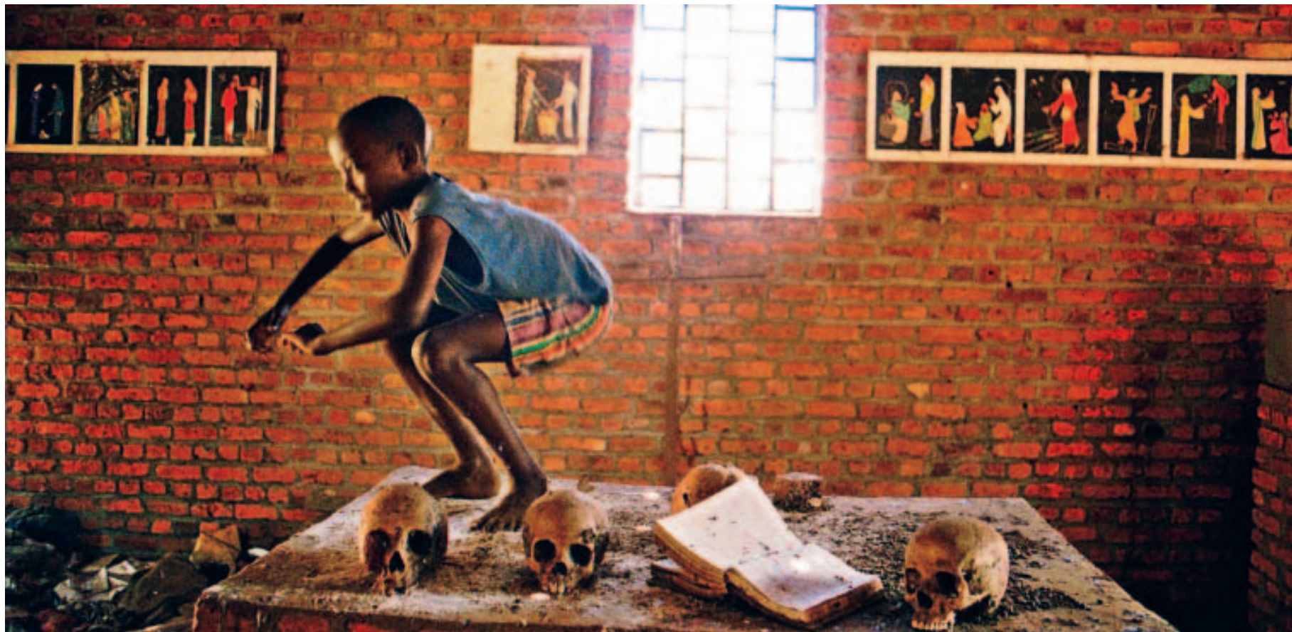
LE 6 AVRIL 1994 À 20 H 26, l'avion du président Habyarimana était abattu. Quelques minutes plus tard, les tueries commençaient...

trouvés quelques jours plus tard par les Casques bleus belges, ensevelis dans le jardin de leur villa.