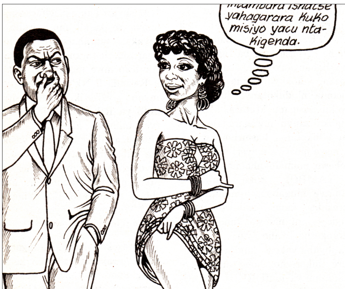
Cette caricature illustre un article du magazine Kangura qui raconte qu'un homme hutu démasque une femme tutsie comme une prostituée prête à tout pour sa « race ». « Sa culotte commence à puer », précise le texte d'accompagnement. (Kangura n° 35)