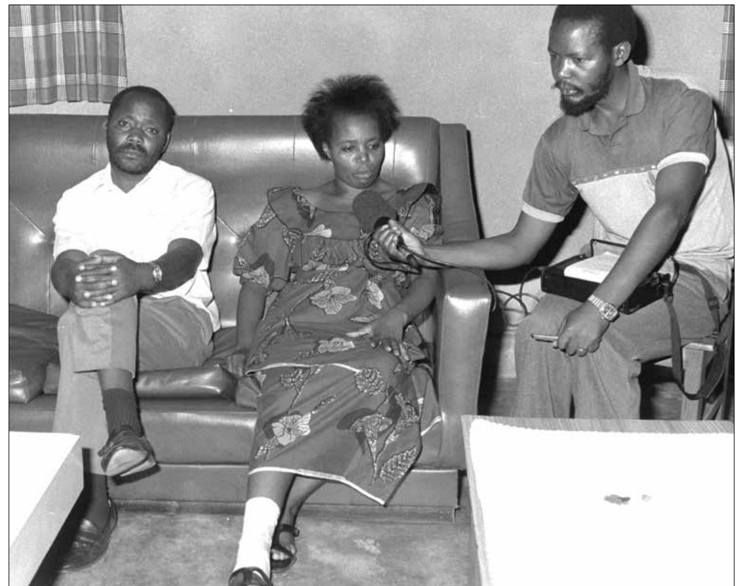
Agathe Uwilingiyimana, femme politique démocrate, était haïe des extrémistes hutus car elle avait supprimé les « quotas ethnique » pour les diplômés scolaires et universitaires. Dans la nuit du 6 au 7 mars 1992, des nervis pénétrèrent à son domicile pour la passer à tabac, ainsi que son mari (voir photo ci-dessus, où le couple est interviewé par un journaliste de Radio Rwanda, le 7 mars au matin).