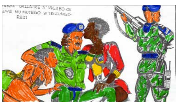
Egalement détesté, le Canadien Roméo Dallaire, commandant des Casques bleus est prétendument manipulé par des prostituées tutsies.