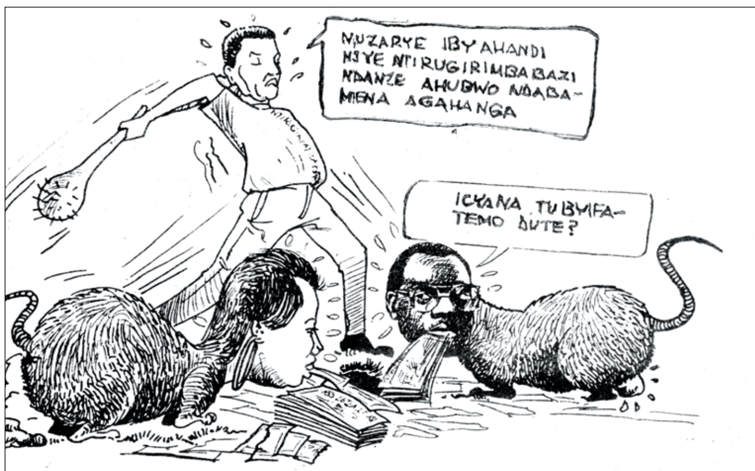
Les caricaturistes extrémistes représentent leurs adversaires sous les traits de serpents, de rats, de cafards, etc. Des animaux malfaisants qu'il serait légitime de tuer à coups de gourdins...