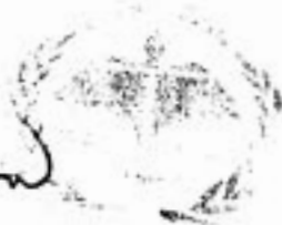
Hassan Bubacar Jallow Prosecutor.