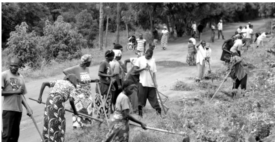
Le « travail », dans son sens initial : des travaux communautaires, comme ici pendant l'umuganda

Ce « travail » se perpétue quand ses auteurs, exfiltrés par la France ou accueillis sur son sol, ne sont pas recherchés et mis en cause avec le zèle que l'on est en la matière en droit d'attendre d'une « grande nation ». Ce n'est en effet pas à l'initiative du ministère public qu'ont été ouvertes en France les procédures judiciaires contre de présumés génocidaires réfugiés sur notre territoire : à ce jour, aucune des 37 actions pénales engagées depuis 1995 contre de telles personnes ou leurs complices n'est le fait d'un procureur de la République, mais uniquement de victimes et d'associations, en particulier le Collectif des