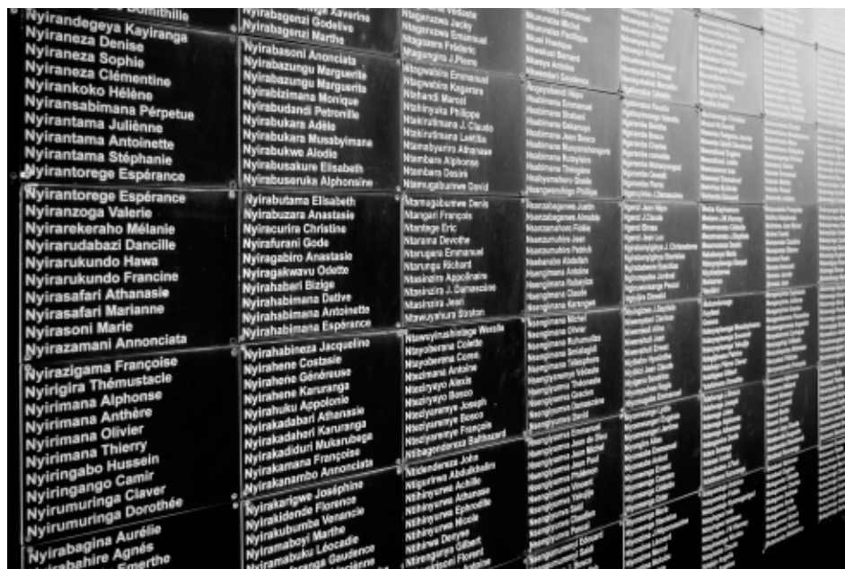
Mémorial de Gisozi, à Kigali

lutter contre ce négationnisme qui s'exerce en dehors de leurs frontières, m'a beaucoup marquée. L'enjeu de le combattre est apparu d'autant plus majeur, comme une urgence et un devoir indispensables.