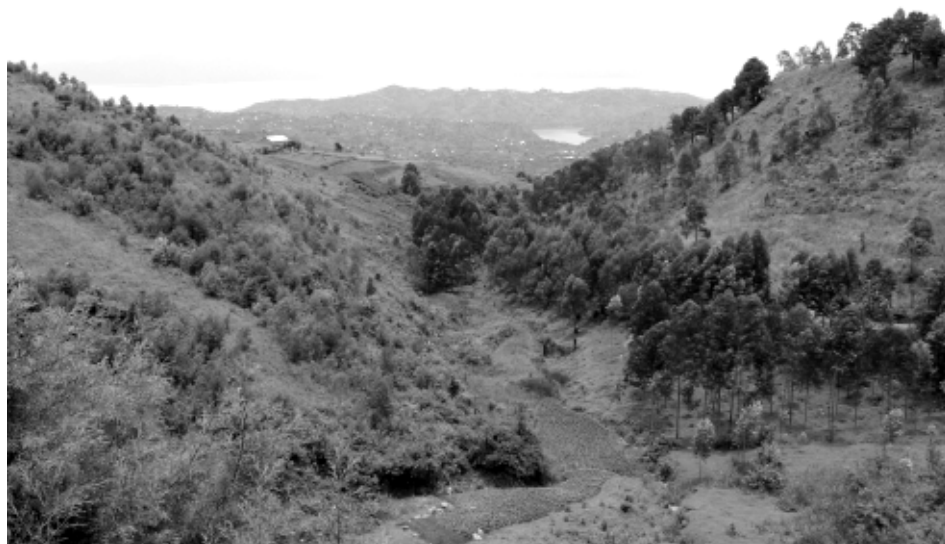
Dans les collines de Biseseo (mars 2018)